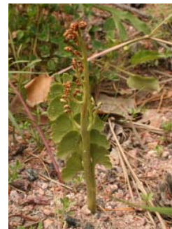
Yhdistyksen avainkasvi eli ketonoidanlukkko ( Botrychium lunaria ) osui silmiimme Hyypjärven harjualueella.