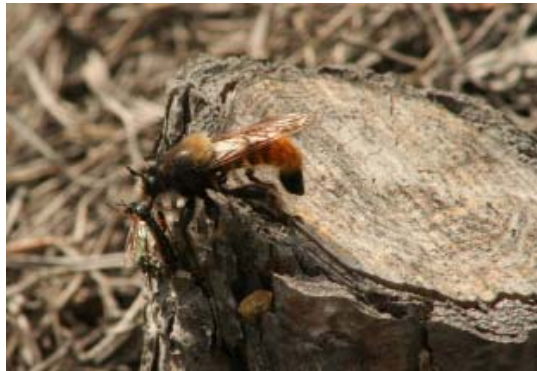
Kuvassa on petokärpänen, mahdollisesti Laphria flava -koiras, joka on saanut saaliiksi jonkin pienemmän kärpäslajin.