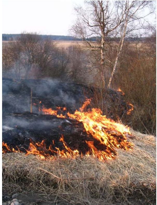
Kulottamaan lähdetään taas keväällä, jos löytyy sopiva paikka! Ehdota meille!

Yhdistyksen vetämän ManTra-projektin päätöseminaari tullaan järjestämään kesäkuussa Varsinais-Suomessa. Arkipäivinä retkeillään ja pidetään seminaaria mantee-reen puolella ja viikonloppuna varsinkin ulkomaan kollegoiden toiveesta retkeilemme saariston perinnemaisemissa. Seminaari järjestetään 6.-10.6.2007. Seminaariohjelma ilmestyy yhdistyksen sivuille ja projektin sivuille www.landscape.fi . Sivuston on rakentanut Keijo Luoto.