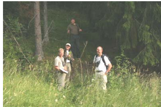
Ruotsalaiset intomielet ovat löytäneet viehansaran ( Carex atherodes ) Häntälästä

kuten harsosammal ( Trichocolea tomentella ), raidankeuhkojäkäkä ( Lobaria pulmonaria ), tuoksumatara ( Galium odoratum ), soikkokaksikko ( Listera ovata ), herttakaksikko ( Listera cordata ) sekä korpisara ( Carex loliacea ). Tunturikurjenhernettä kasvoi noin 150 yksilöä pienellä alueella Kalaton –suppalammen vieressä, joten samalla harrastettiin vähän seurantaakin. Esiintymän koordinaatit laitettiin kepsulla talteen.