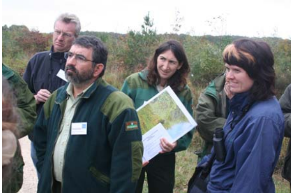
EUROSITEn jäsenistölle esitellään luonnon monimuotoisuuden hoitoa á la France

Vuosikokouksessa pohdittiin myös tulevien vuosikokousten paikkaa ja ajankohtaa. Ehdotin meidän seutukuntaamme ja iloisen uutisenä vuoden 2008 AGM saataneenkin Suomeen, Saaristomerelle ja Turun kaupunkiin. Asia varmistuu syksyn 2007 AGM:ssä Romaniassa. EUROSITEn suomalaisjäsenet valmistelevat asiaa. Järjestöön onkin meidän yhdistyksemme lisäksi uusina jäseninä liittynyt sekä Turun kaupunki että Metsähallitus. Tästä kuullaan vielä jatkossa!